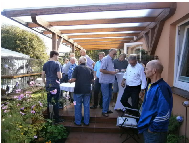
Bei der "Jungtierbewertung" im Garten der Fam. Schingen