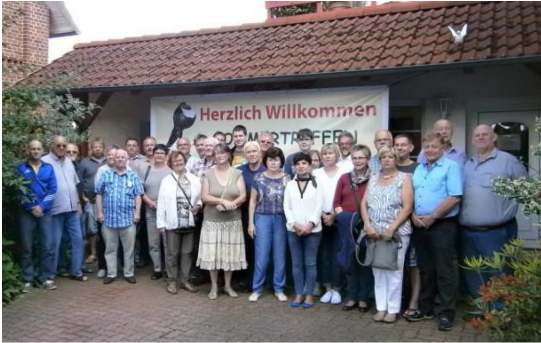
Das gemeinsame Gruppenfoto, eine erfreulich "große Schar" Anwesende